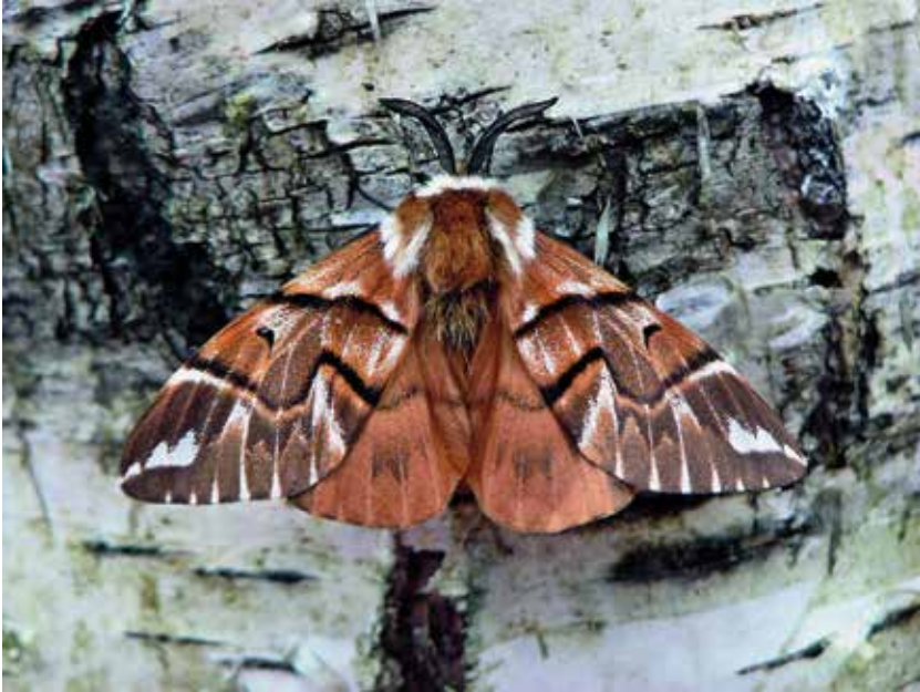
Abb. 1. Männchen des Birkenspinners ( Endromis versicolora ).