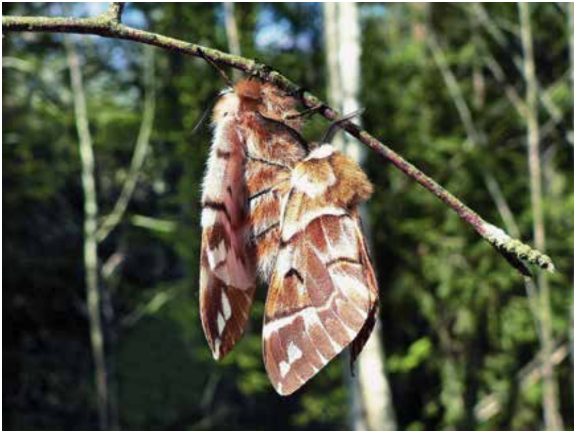
Abb. 3. Typische Stellung des Birkenspinners ( Endromis versicolora ) während der Kopula.