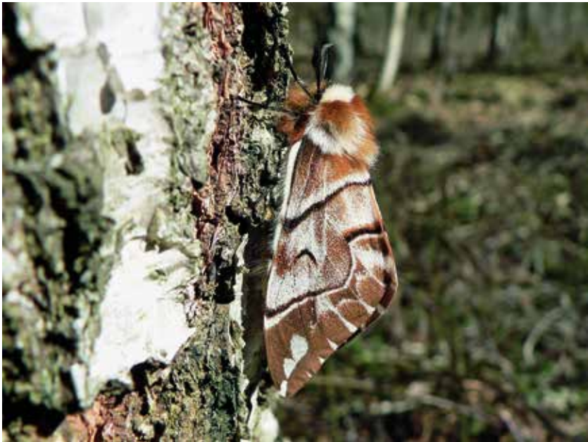
Abb. 2. Weibchen des Birken spinners ( Endromis versicolora ).