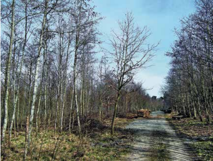
Abb. 8. Forstlich begründete Schwarzerlen-Kultur: Auch in solchen Beständen lassen sich durch Einsatz unbegatteter Birkenspinner- ( Endromis versicolor )-Weibchen regelmäßig Männchen anlocken (Leinfeld-Echterdingen, Federlesmahd, März 2012)

darauf wirkende Witterungsfaktoren zurückzuführen sein könnten (z. B. Hauptwindrichtung am Locktag). Wäre dem so, ließe sich nicht oder nur sehr begrenzt auf Herkunftsorte und Habitate der nachgewiesenen Männchen schließen. Auch Schlussfolgerungen hinsichtlich Verbreitung und Häufigkeit der Art könnten durch einen sehr großen Anlockradius und ein weiträumiges „Einzugsgebiet“ der mit Pheromonen lockenden Weibchen kaum getroffen werden.