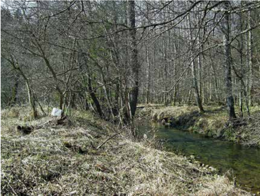
Abb. 7. Erlen-Sumpfwald in einer Bachaue des Schönbuchs: Habitat des Birken-spinners ( Endromis versicolora ) (Bebenhausen, Kleines Goldersbachtal, März 2012)