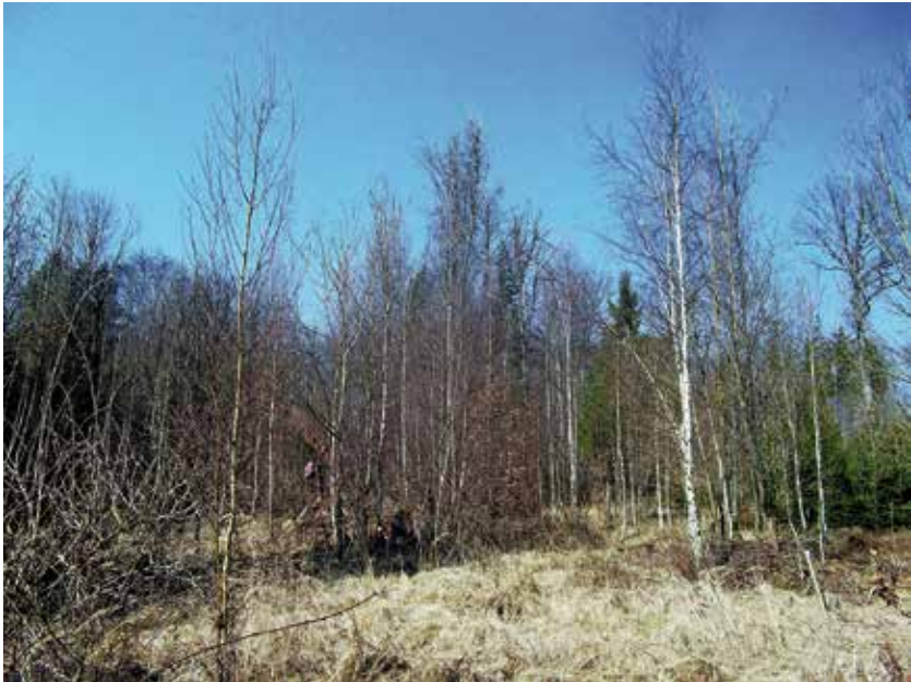
Abb. 6. Birken-Sukzessionswald auf Sturmwurflichtung des Orkans Lothar: Habitat des Birkenspinners ( Endromis versicolora ) (Walddorfhäslach, Reichenbachtal, März 2012, Foto: T. BAMANN)

Der Lockgebiets-Auswahl entsprechend konnte der Birkenspinner am häufigsten in Vorwaldstadien mit Birke nachgewiesen werden (Beispiel s. Abb. 6). In diesem Habitattyp fanden Männchen-Anflüge in 27 von 44 beprobten Gebieten statt, was einem Besiedlungsgrad von 61% entspricht. Mit Ausnahme des nur einmal außerhalb des Untersuchungsgebiets beprobten Typs der haselreichen Steinriegelhecken liegen auch aus allen übrigen der 5 untersuchten Habitattypen Birkenspinner-Nachweise vor. Einen sehr hohen Besiedlungsgrad von 80% (12 Gebiete mit Anflug) weisen Erlen-Sumpf- und -Bruchwälder auf (Beispiel s. Abb. 7). Aus diesem Habitattyp stammt u.a. auch der einzige Nachweis aus dem ansonsten offenbar unbesiedelten Nordteil des Untersuchungsgebiets (Glemswald). Doch auch in Erlenbeständen sonstiger Standorte wurde die Art immerhin in 4 von 5 beprobten Gebieten nachgewiesen (Besiedlungsgrad ebenfalls 80%) (Beispiel s. Abb. 8). Dreimal wurden Weibchen auch in Gebieten ohne (erkennbare) Habitateignung exponiert. In allen Fällen fand auch dort ein Anflug von Birkenspinner-Männchen statt. Allerdings liegen sämtliche dieser Stellen im Kerngebiet der naturräumlichen Verbreitung des Birkenspinners und keine weiter als ca. 1,5 km vom nächsten größeren Erlen- oder Birkenbestand entfernt.