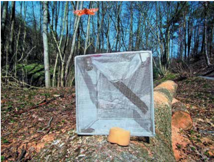
Abb. 4. Mit unverpaarten Weibchen besetzter Anflugkäfig in der Aue des Rosenbachs bei Tübingen-Hagelloch (März 2012). In diesem Fall ist die Reuse geöffnet und ermöglicht somit dem anfliegenden Männchen (oberer Bildrand) Zugang und Verpaarung.

Die dieser Arbeit zugrunde liegenden Freilanddaten stammen weitgehend aus den Jahren 2011 und 2012. Ergänzend flossen Einzeldaten aus 2008 und 2010 in die Auswertung mit ein. In den Haupt-Untersuchungsjahren 2011 und 2012 lagen die erfolgreichen Locktermine im Zeitraum zwischen dem 21. März und dem 02. April.